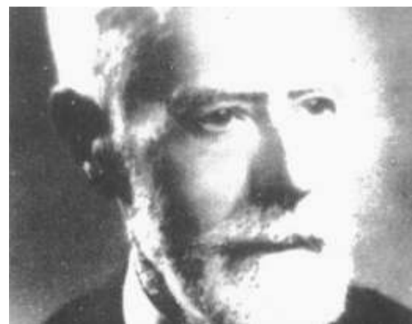
«Auca dels socarrats». Baix, recreació dels fets de Vila-real i retrat de Sarthou. / LAURA PITARCH / BENET TRAVER

da, un precedent del que, l'any següent, ocrorreria a Xàtiva.